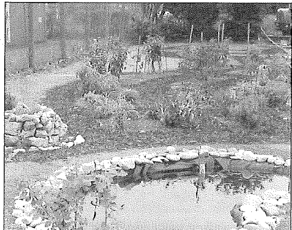
Nach 72 Stunden nicht wiederzuerkennen: Die Ergebnisse der Projektteams beeindrucken.

80 Helfer aus der KJG-Mitarbeiterrunde, Sommerlager-Teilnehmer, Ministranten und aus dem Gallus-Jugendchor beteiligten sich an den Arbeiten im Außengelände. Der schmucklose Hügel zwischen dem Gemeindehaus und dem Vereinshaus des Ruderclubs ist abgetragen, der dahinterliegende Hang befestigt und ein Beachvolleyball-Feld angelegt. Außerdem erneuerte das Team das Ballfangnetz und baute eine Feuerstelle samt Sitzmöglichkeiten. „Das war eine tolle Teamleistung. So etwas kann man nur gemeinsam schaf-