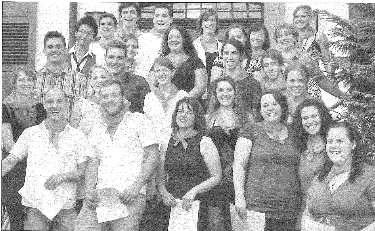
Vor großen beruflichen Herausforderungen: Die Theresia-Scherer-Schule verabschiedete 25 neue Heilerziehungspfleger.

Während der Prüfungen sei von den „Kardinalsymptomen“ die Rede gewesen. Das möchte er zum Anlass nehmen, den Absolventen die „Kardinaltugenden“ mit auf den Weg zugeben: Klugheit, Ge-