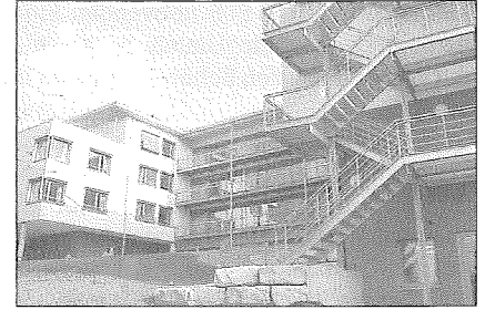
Seniorenzentrum St. Fridolin, Neubau