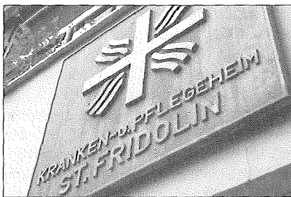
Das Pflegeheim St. Fridolin kooperiert künftig mit der Sozialstation – im Zeichen katholischer Fürsorge.