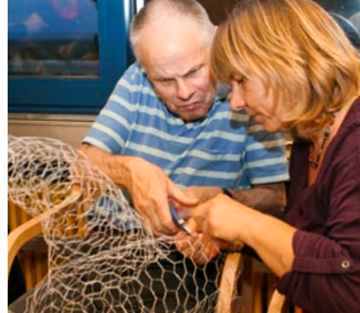
Die Teilnehmer des inklusiven Kunstprojekts bei der Gestaltung von Nana-Figuren.