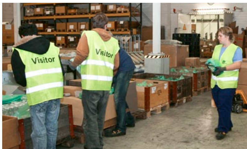
Die Außenarbeitsgruppe des St. Josefshauses beim Verpacken der Elektronikteile im Werk 2 der Magnetic Autocontrol GmbH in Schopfheim.